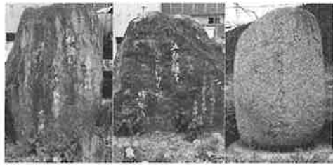
(松前町立松前中学校長)

しかしながら、ここに記した句碑にも勝る「地域の宝」が、3基の句碑に挟まれた道で毎日見られるのです。私にとつては、この光景も地域のすばらしい文化の一つだと感じています。