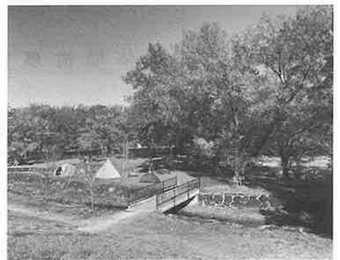
を委ねて、すてきな時間を過ごしてみてください。 (前愛媛文教月報編集協力委員 竹縄 浩二)

公園内には、日本で初めてのスラックライン専用パークも整備されており、天気の良い休日には、テントが並び、家族連れや気の合う仲間、バーベキューやデイキャンプを楽しむたくさんの方で賑わいます。ぜひ、東温市にお越しください、「せせらぎの池だんだん」と四季の景色に身