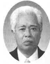
元松山教育事務所長