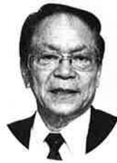
(財)愛媛県教育会理事長