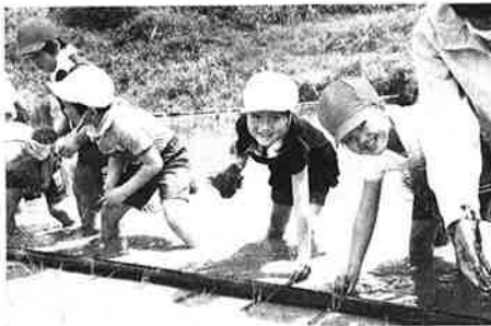
久万高原町立直瀬小学校