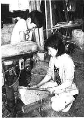
西予市立大和田小学校

「えひめ教育の日」関連写真の募集に、県内六四校より「ありがとうで つなげよう」をテーマとした作品一九〇点をお寄せいただきました。