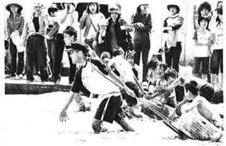
松山市立堀江小学校