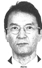
井小 吉長 勝聡 南校 温市 東 古川

マラソンの練習をしていたとき、「よく、四十kmも走れますね。」と言われたことがあった。