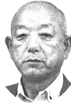
司法書士・行政書士