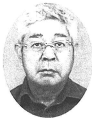
会 教育 島和 豊田 進 OB

退職後、悠々自適などと洒落た生活はできないものの自由な時間を生かした野菜作りや散歩などを楽しんでいる。