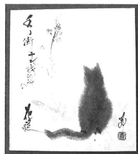
俳画・水墨画教室 西島 節子作