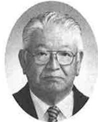
元愛媛県小中学校長会副会長