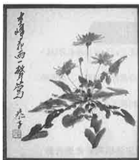
俳画・水墨画教室 山口 恭子 作

後に、サクソフォーン専攻として進学し、クラシック畑で修行を積んできましたが、渡辺貞夫のジャズナンバーを奏でるのが今でもちよっとした楽しみです。