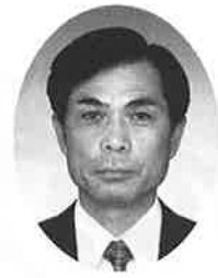
愛媛県教育研究協議会 副会長