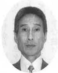
小津市 津頭 秀一 西子市 教 山下

床してから冷水摩擦(七十年以上)、真向法、腰痛体操、ダンベル体操をして、神様、仏様に感謝の心と今日一日がみんなの幸せにつながりますようにお願いする。それから山歩き、帰ってきて朝食にする。昼間はいろいろ。夕方はまた山道を歩く。入浴、仏様への祈り、ストレッチ体操をして、夕食。午後九時頃からお湯割り焼酎をコップに二三杯で一日終了。読書日記は六十四年ほど続いている。就床は午後十一時といたるところ。変わったことをしているわけではないがテレビは時代劇やドキュメンタリーが多い。医者要らずではなく、定期的に通っている。最後にできるだけ多くの人との交流を大切にしている。