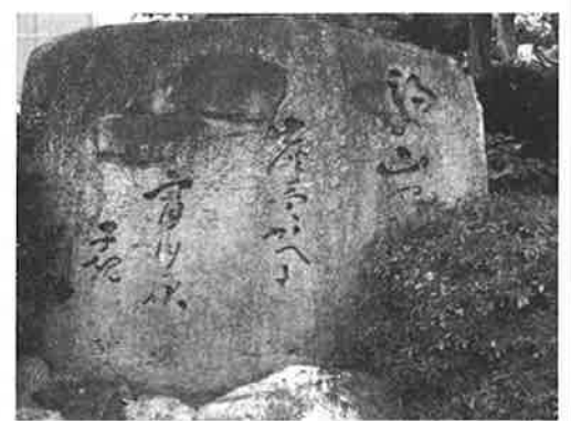
(参照「愛媛の文学碑」県高校教育研国語部会編)

子規の頃には、作った炭を松山の城下に売りに行き、月を仰ぎながら家路をたどる炭売りの姿が見られたのでしよう。炭を知らない世代も増えた昨今、隔世の感があります。季語は炭売、季節は冬。宵月は新月だそうですが、この句を読んでみると、寂しくも冴え冴えとした夜空に月が浮かんでいる、そんな情景を想像してしまうのですが、いかがなものでしょうか。