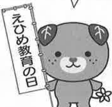
愛媛県イメージアップキャラクター みきゃん