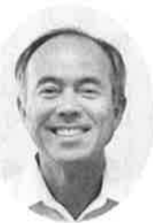
中野市長 柳原 裕史 今治市 柳原 裕史