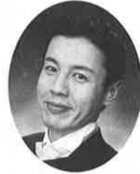
タレント・司会者 松山市立雄新中学校PTA副会長