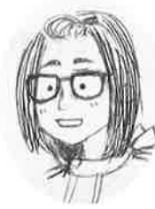
中北大洲市教 友美 角藤

春の訪れとともに、黄色の絨毯が広がる五郎橋。菜の花の黄色の中に五郎橋の赤が一段と映え、美しい景色を生み出します。