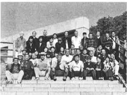
研修旅行（おろちグループ）

様々な行事を通して現職とOBが一体となり、出会いや交流、心のつながり・絆を深め、楽しく愛される教育会を目指しています。