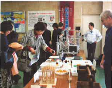
松山工業高・展示