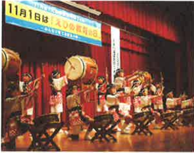
久米小・水軍太鼓

愛媛県のイメージアップキャラクター「みきゃん」「ダークみきゃん」も駆け付け、制定十周年となる「えひめ教育の日」に彩りを添えていただきました。