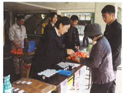
伊予農業高・物産販売