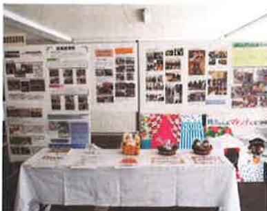
松山商業高・展示