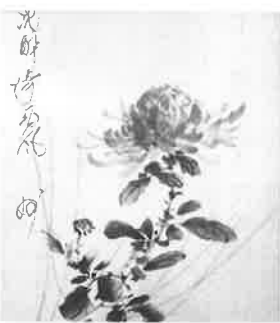
俳画・水墨画教室 佐野 妙子 作