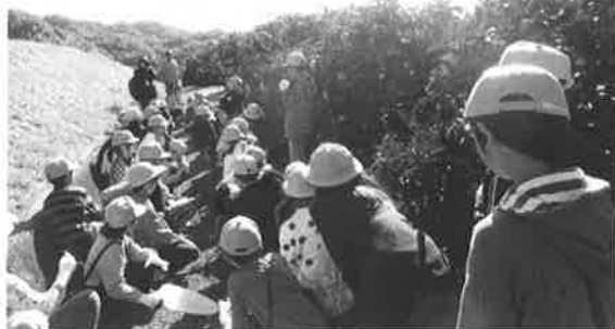
(教頭 神野 浩彦)