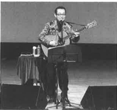
公益財団法人「風に立つライオン」