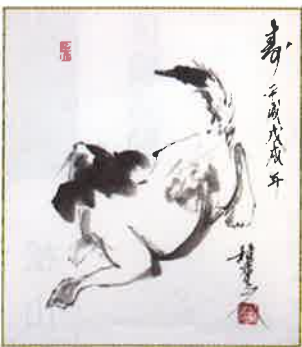
(大倉可貴先生・画)

政や関係機関・団体と一層連 携・協働して、真の「公益」 の具現化を目指し、さらなる 事業の充実・強化に努めてま いります。 公益財団法人として運営してい くためには、①公益目的事業 比率が全事業の五〇%以上、 ②各公益事業がそれぞれ収支 相償(赤字)、③遊休財産額が 一定額以下という要件があり ます。 これらの要件をクリアし ながら公益事業を充実・強化 するためには、これまで以上 に人的支援や財政的支援を強 化する必要があります。人的 支援にはOBの皆さんの御理 解・御協力なくしてはできま せん。財政的支援には、唯一 の収益事業であります文教会 館のより一層の御利用や子ど もたちの学力向上につながる 学習資料の採択をお願いしな ければなりません。 会員はじめ各位の御支援・ 御協力をお願いし、新年のご あいさつといたします。