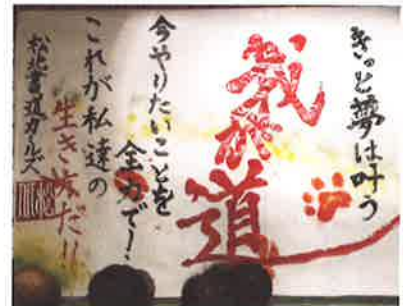
松山北高・書道パフォーマンス